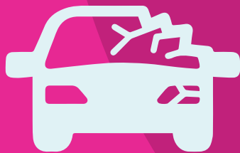
TABELLE DANNI DAMAGE TABLES